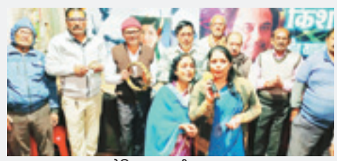
खर कोकिला का तृतीय पुण्य स्मरण